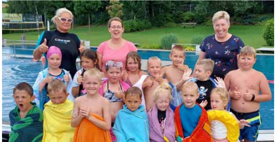
Mit viel Spaß haben die Kinder große Fortschritte gemacht!