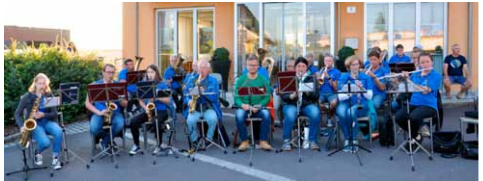
rechts unten: in Herzogsdorf - auch für Kinder und Familie war was dabei.