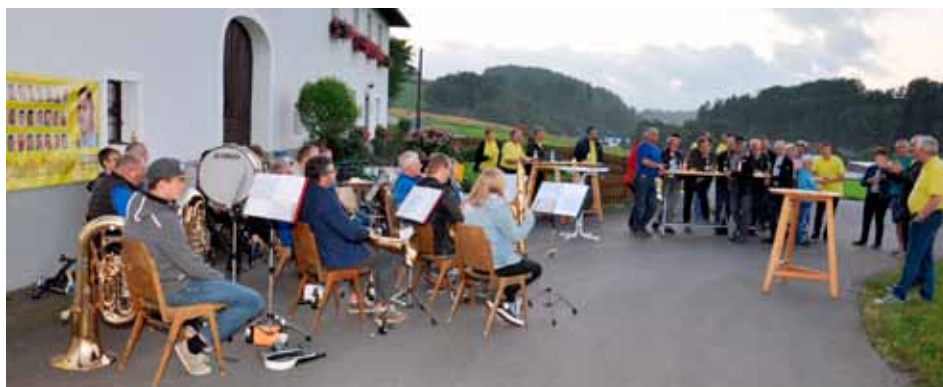
In Gerling mit der Musikkapelle Herzogsdorf