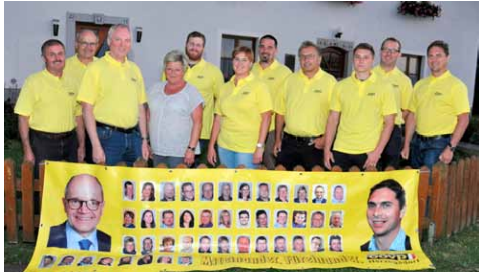
oben: Das Team der OÖVP-Herzogsdorf beim Baun z`Gerling