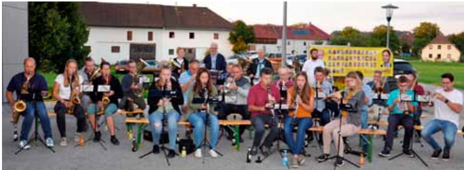
links: In Neudorf mit der Musikkapelle Neuberling.