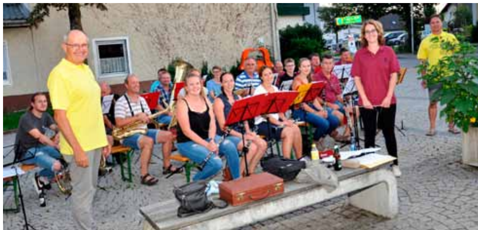
In Neußerling am Ortsplatz mit der Musikkapelle Neußerling

Angefangen haben wir in Neußerling auf dem Ortsplatz . Es war ein lauer warmer Abend. Bei Bier, Wein und Snacks spielte der Musikverein Neußerling bekannte Musikstücke. Es wurde lange diskutiert und interessante Gespräche geführt. Unsere neuen Gemeinderäte stellten sich erstmals öffentlich bei den Einwohnern von Neußerling vor. Der zweite Dorfabend war in Gerling beim „Baun z`Gerling“ . Diesmal wurden wir vom Musikverein Herzogsdorf verwöhnt. Auch hier kamen die Gespräche nicht zu kurz. Bedingt durch die Witterung hat es diesen Abend relativ schnell abgekühlt, dennoch wurden unsere Getränke gern angenommen. In Herzogsdorf waren wir am dritten Tag, wieder mit dem Musikverein Herzogsdorf. Mit den wunderbaren Stücken der Musikkapelle und vielen Gesprächen wurde es ein langer unterhaltsamer Abend. Am vierten Tag in Neudorf erwartete uns schon der Musikverein Neußerling mit Marschmusik. Durch die Nähe zur Gemeindegrenze haben wir auch mit einigen Gästen aus St. Veit und sogar einen Gast aus Gmunden, Gespräche führen können. Leider ist uns witterungsbedingt ein geplantes Treffen in Eidendorf ausgefallen, wir werden versuchen es baldmöglichst nachzuholen.